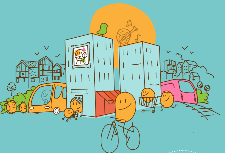
LE PROJET URBAIN D'ICI 2026