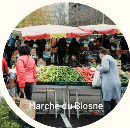
Marché du Blosne

Ce quartier bien desservi par les transports et doté de nombreuses commodités est imprégné d'une atmosphère conviviale, où il fait bon vivre au quotidien. À proximité immédiate se trouve également le résidentiel quartier Sainte-Thérèse, une véritable pépite de la ville de Rennes. Chaque mercredi, le marché de Sainte-Thérèse, coloré et animé, offre une variété de produits locaux, de produits frais et d'artisanat. Il est non seulement un lieu de commerce, mais aussi un point de rencontre incontournable où les résidents se retrouvent pour échanger et profiter de l'ambiance animée.