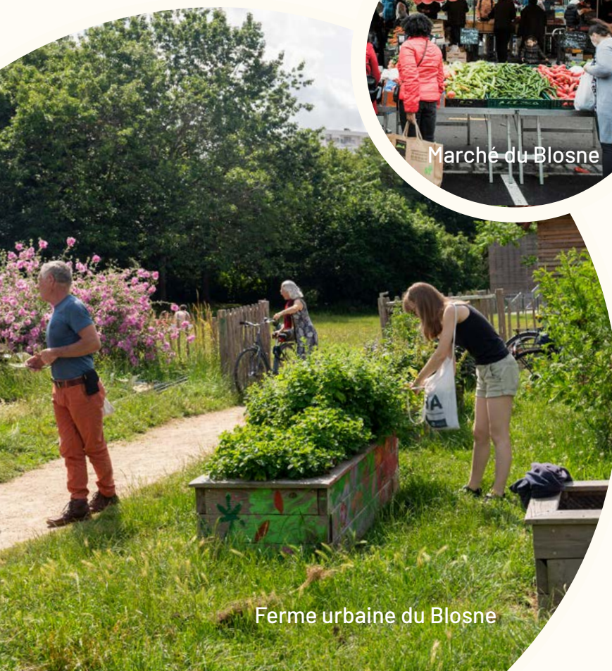
Ferme urbaine du Blosne