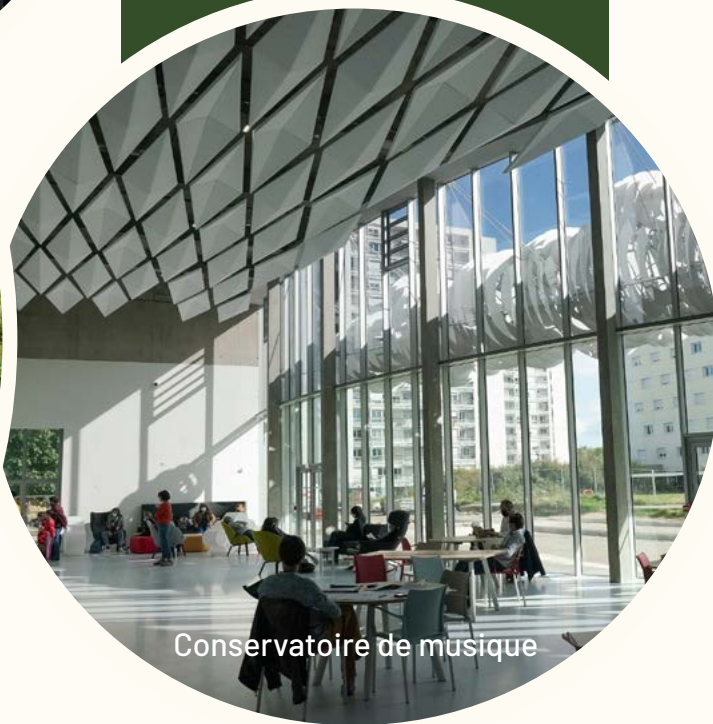
Conservatoire de musique