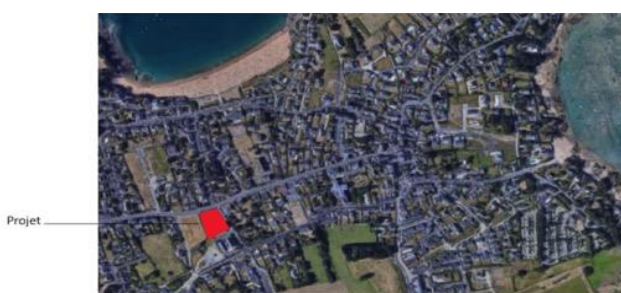
Saint-Malo: vue aérienne

Le premier projet mis en place dans ce cadre va s'établir à Rotheneuf, sur le terrain de l'ancienne école vendu par la Ville (2 656 m 2 ), à 300 mètres de la mer et à proximité de tous les services. Il s'agira de trois résidences comptant 30 logements, implantés autour d'un cœur îlot paysager et s'intégrant bien dans l'environnement existant. Chaque bâtiment reprend les qualités du logement individuel (jardin privatif, entrée individualisée celliers, terrasses...). Un espace annexe sera pensé avec les futurs habitants en fonction de leurs besoins.